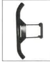
AS05609 Ochranný nárazník přední