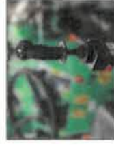
08109/JOY Joystikové ovládání