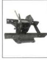
EZH-01 Etažový závěs s hubicí