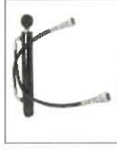
HTB-430 Hydraulický třetí bod 430 mm HTB-220 Hydraulický třetí bod 220 mm