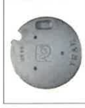
BMZ-242 Závaží do kol 100 kg (2x50 kg)