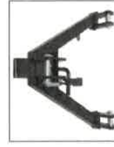
DRZ-103 Přední trojúhelníkový nyczlázavěs kategorie 1N (430 mm)