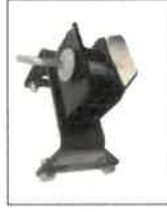
AS00491 Otočný závěs na valník