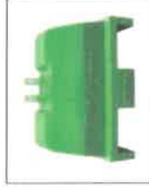
PZ-200 Závaží třibodové 200 kg