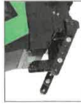
PZA-101 Přední třibodový závěs kategorie ISO-730/1N