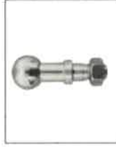
07657/b Koule ISO 50 do zadního rámového závěsu