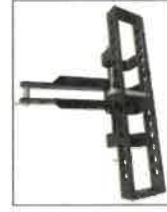
S0554 Zadní rámový závěs