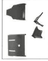
KMPB-01 Spodní kryt motoru + podvozku + pádk brzd