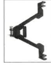
DRZ-203 Zadní trojúhelníkový nyczlázavěs kategorie 1 (680 mm)