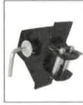
THP-01 Tažná hubice přední