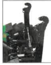
ZTRZ-1 Rychloupínací háčková ramena třibodového závěsu zadní