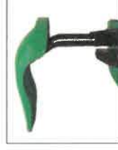
ST-01 stříška laminátová