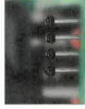
08109/4 Čtyřsekční rozvaděč + 2x hydraulický okruh přední / 2x okruh zadní