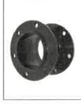
S0561/d Nástavce kol 300 mm