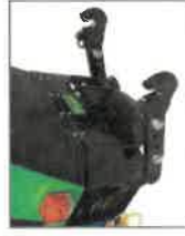
PTZR-1 Rychloupínací háčková ramena třibodového závěsu přední