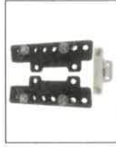
AS00491/a Etažový závěs