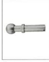
07657/a Koule ISO 50 do hubice