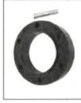
S0561/a Nástavce kol 100 mm S0561/b 150 mm S0561/c 200 mm